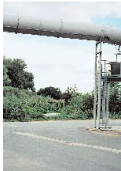
brand eins Neuland 01_ Südpfalz_Überblick