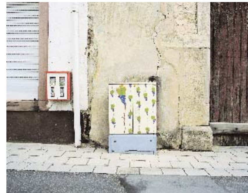
brand eins Neuland 01_Südpfalz_Überblick

Und zielführender für die Region ist es im Zweifel auch. ✿