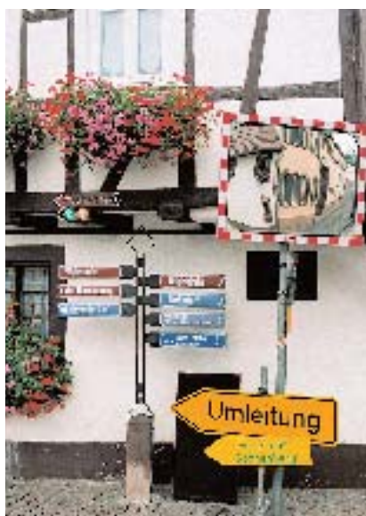
brand eins Neuland 01_Südpfalz_Überblick

reichte, ganz klassisch, gerade bis zum eigenen Kirchturm. Die durch Landwirtschaft und Weinbau nicht gerade optimal für die Zukunft aufgestellte Südpfalz drohte angesichts der Daueraufmerksamkeit für den deutschen Osten zum neuen Zonenrandgebiet zu verkümmern. Aus jener Zeit ist ein Gerichtsurteil überliefert. Der Verurteilte, ein Pfälzer, gehöre einem Menschen-schlag „mit einer geradezu extremen Antriebsarmut“ an, befand der Richter, einer Spezies, „deren chronischer Unfleiß sich naturgemäß erschwerend auf ihr berufliches Fortkommen auswirkt“.