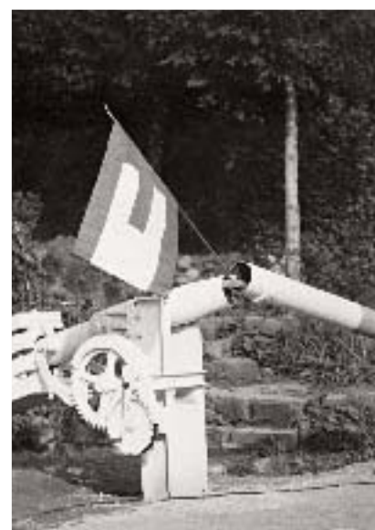
Sie schlichen sich an, überrumpelten listig die Zöllner, um anschließend Schlagbäume und Grenzpfähle zu zersägen. Ihre Flagge stand für ein vereintes Europa.