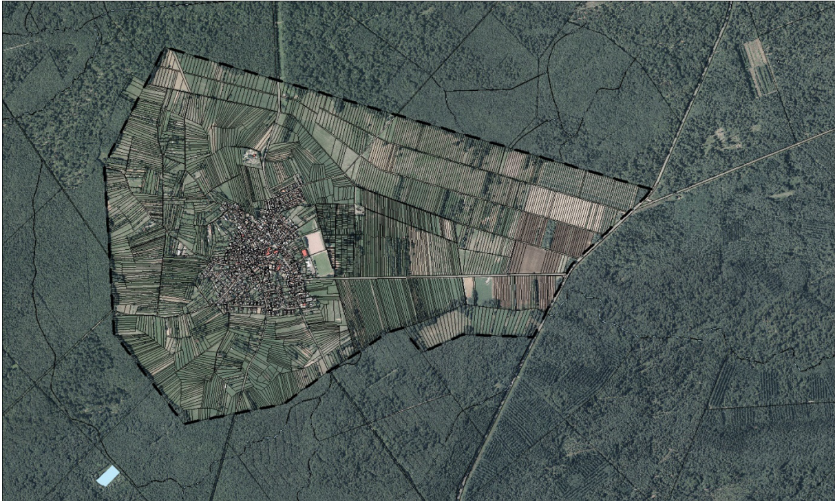
Anlage 1 b: Liegenschaftskarte der Gemarkung Büchelberg und Geltungsbereich der Verfügung