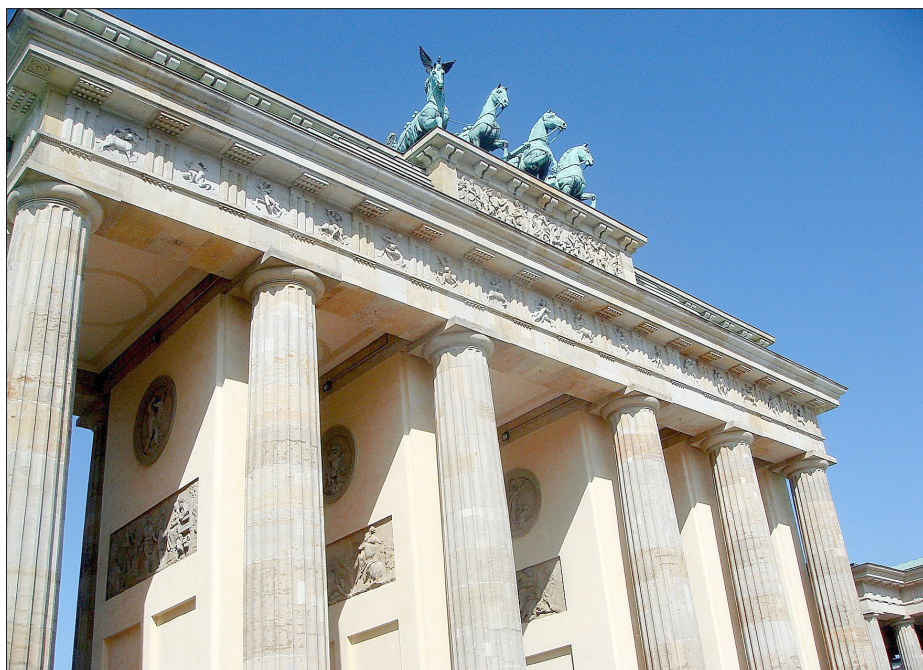
Natürlich wird auch das Brandenburger Tor besichtigt.

Familien oder Erziehende, die bestimmte Einkommensgrenzen unterschreiten, können Lernmittelfreiheit (kostenlose Schulbuchausleihe) beantragen. Anträge dafür wurden von den Schulen verteilt. Die Anträge sind auch auf der offiziellen Website der Kreisverwaltung unter www.kreis-germersheim.de/schulbuchausleihe verfügbar und können bequem online gestellt werden. Die Anträge können noch bis einschließlich 16. März 2026 bei der Kreisverwaltung Germersheim eingereicht werden. Bitte beachten: es muss für jedes einzelne Kind ein separater Antrag gestellt werden. Weitere Infos auch unter https://bildung.rlp.de/lmf/