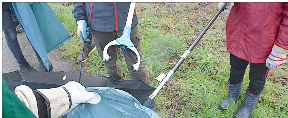
Für die Umwelt unterwegs mit Zangen und Säcken.