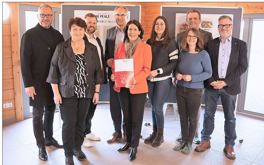
Nach der Übergabe des Förderbescheids.