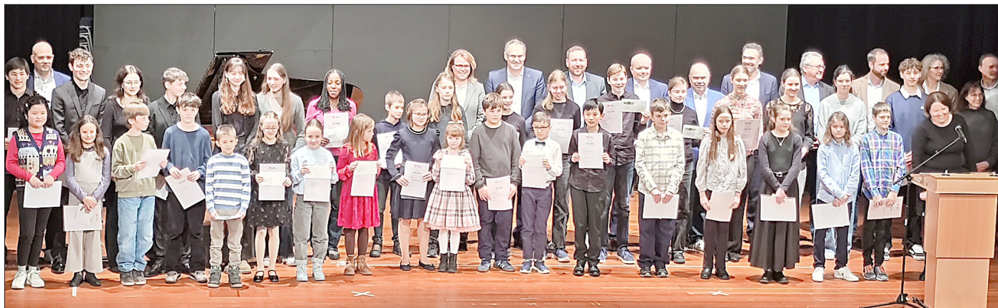
Strahlende Gesichter nach der Preisverleihung.