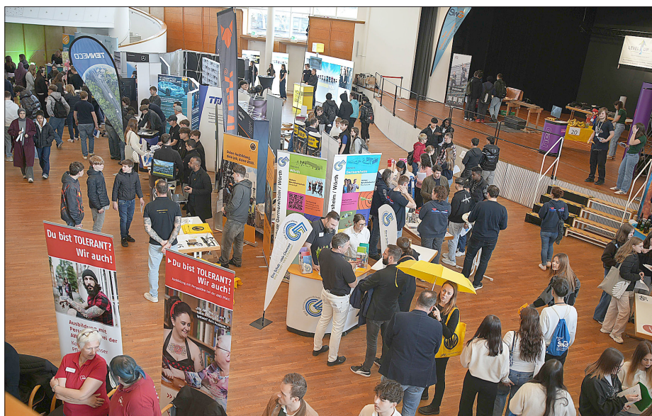
Die Bildungsmesse „Level up“ war sehr gut besucht.

Wer die Bildungsmesse „Level up“ verpasst hat: am Freitag, 24. April, von 10 bis 15 Uhr findet in der Jugendstil-Festhalle in Landau die Messe „Startklar“ für Ausbildung und Beruf statt. Die Kreisverwaltung Germersheim wird dort auch wieder mit einem Stand und mit vielen Informationen vor Ort vertreten sein.