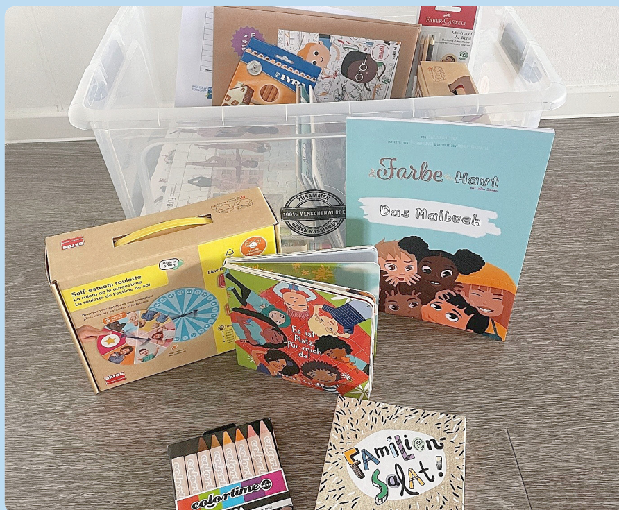
Der Inhalt der Diversity-Boxen.

Mit diesen Diversity-Boxen möchte das Büro für Migration und Integra-