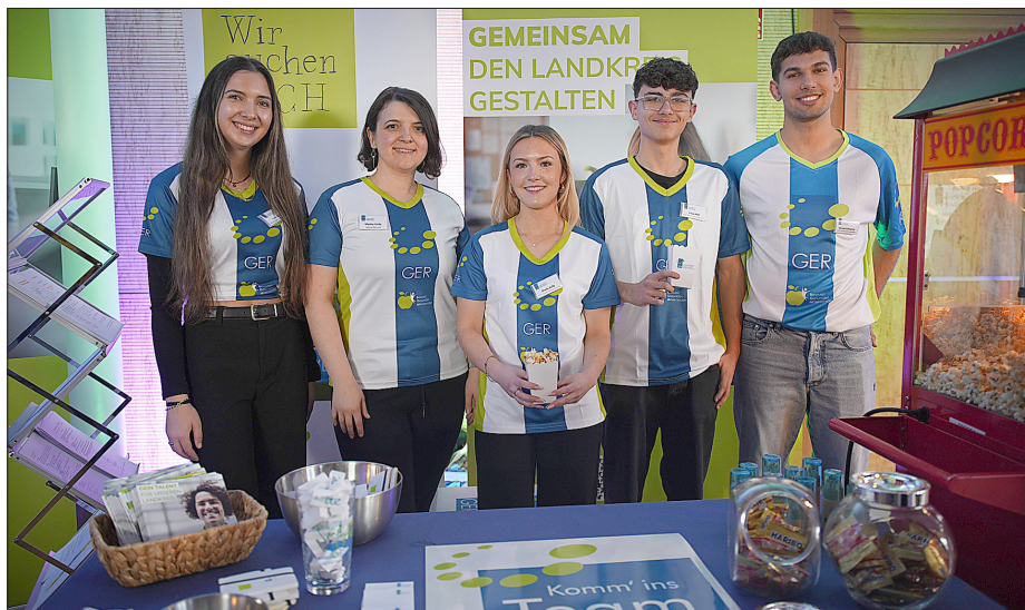
Das Kreisverwaltungsteam am Stand freut sich auf viele Interessierte.