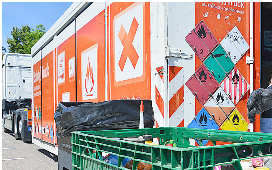
Hier kann man den Problemmüll abgeben.