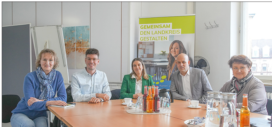
Beim gemeinsamen Austausch.