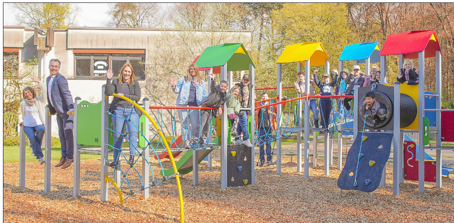
Das neue Spielgerät macht allen sichtlich Spaß.