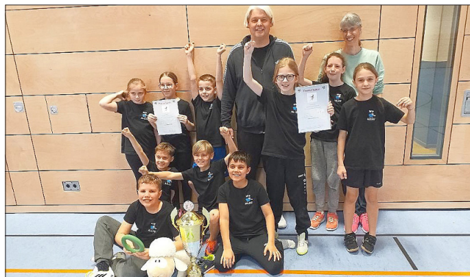
Die strahlenden Sieger.