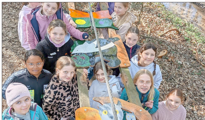
Beim Ferienprogramm.

Das Projekt „MINT-SPASS“ geht in sein drittes Jahr und hat sich erfolgreich in der Region Südpfalz etabliert. Die Mitarbeitenden sind mit AGs im Ganztage an Schulen aktiv, veranstalten MINT-Tage in Büchereien, führen Ferienprogramme durch und kooperieren unter anderem mit dem SciTec-Labor der Rheinland-Pfälzischen Technischen Universität (RPTU) in Landau sowie mit Jugendzentren vor Ort. In der ersten Osterferienwoche fand ein MINT-Ferienangebot für Mädchen im Alter von zehn bis 14 Jahren im Fun Forest in Kandel statt. Begleitet wurden sie dabei von einem MINT-SPASS-Mitarbeiter sowie einem Lehramtsstudierenden der Rheinland-Pfälzischen Technischen Universität (RPTU), Campus Landau. Ziel ist es, Kindern und Jugendlichen einen niedrigschwelligen Zugang zu Technik, Naturwissenschaften und kreativem Arbeiten zu ermöglichen.