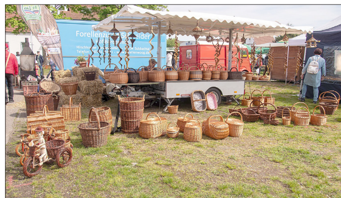
Auch Körbe gibt es auf dem Bauern- und Genussmarkt.