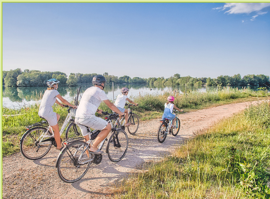
Radtour am Altrhein Neupotz.