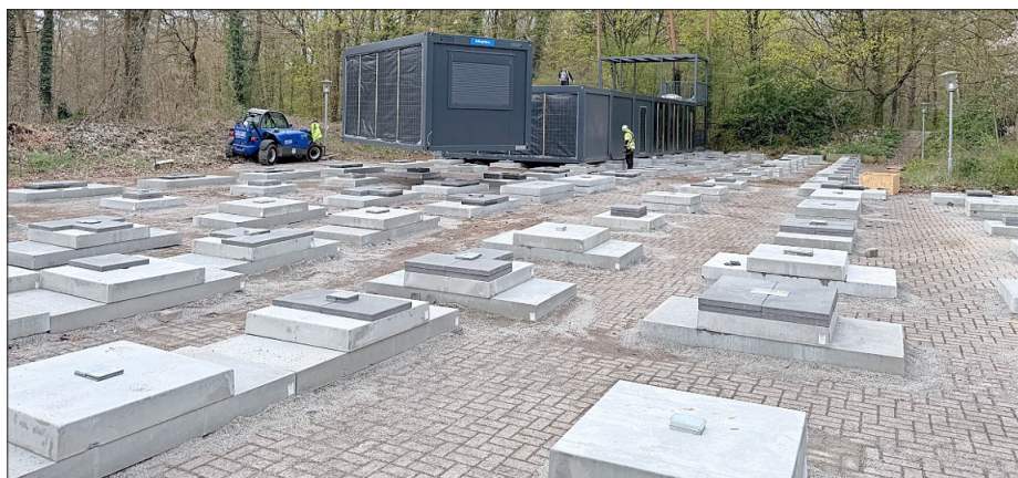
Während des Aufbaus in den Osterferien.

Aktuell sind die Container in anthrazitfarbenem Design aufgestellt. Eine farbliche Folierung folgt in den kommenden Monaten und wird dem Erscheinungsbild des Campus angepasst. Bis zur voraussichtlichen Fertigstellung des Neubaus im Sommer 2029 wird das Gymnasium Rheinzabern in den Containerräumlichkeiten untergebracht sein.