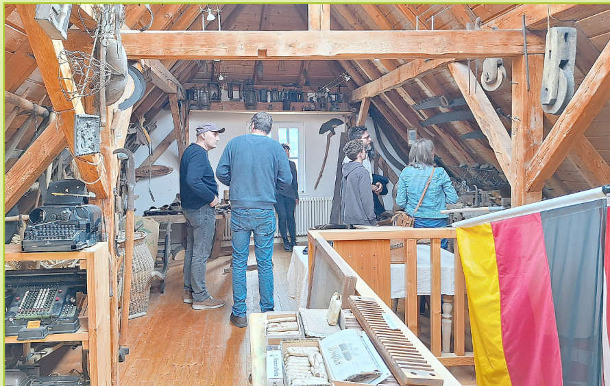
Führung im Heimatmuseum Freckenfeld.

Die offizielle Eröffnung findet um 11 Uhr am Tabakrundweg in Hatzenbühl statt. Für die musikalische Begleitung sorgt der Musikverein Hatzenbühl.