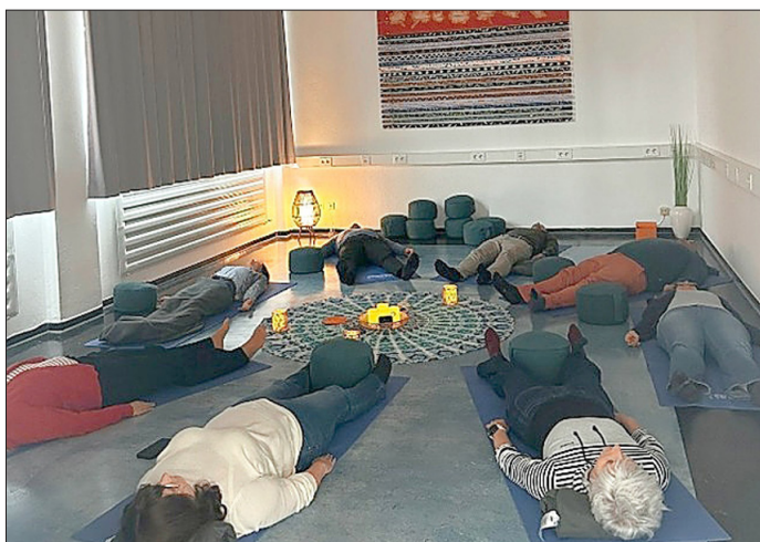
Klangmeditation im Raum der Stille.