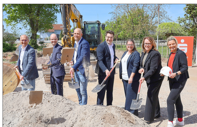
Spatenstich in Rheinzabern.