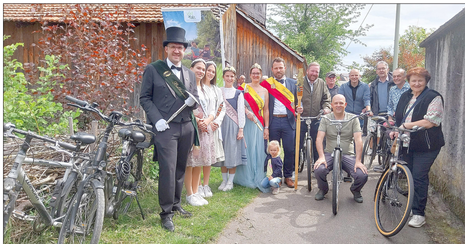
Und los geht's. Der Start zur Jubiläumstour von Museum zu Museum.