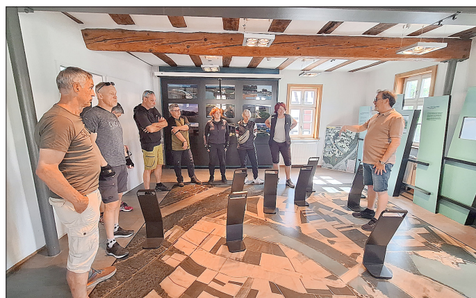
Gebannt lauschten die Besucherinnen und Besucher den Führungen im Ziegeleimuseum in Jockgrim (linkes Bild) und im Haus Leben am Strom in Neupotz.