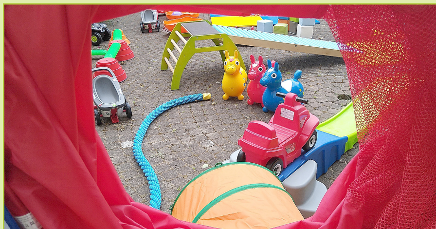
Spaß und Bewegung für die Kleinsten.