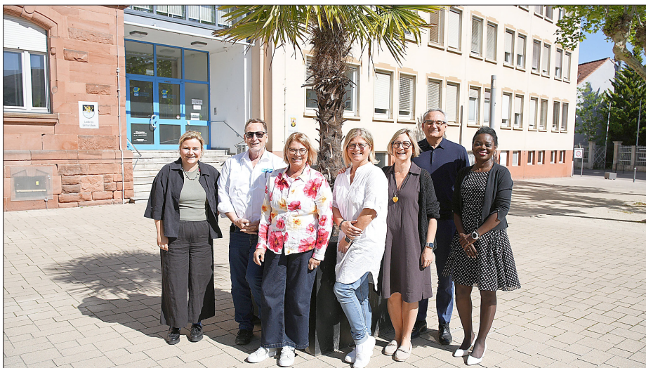
Eine enge Zusammenarbeit der Gleichstellungsbeauftragten und der Organisationen wie dem Weissen Ring ist wichtig.

Beim jüngsten Treffen der Gleichstellungsbeauftragten im Kreis Germersheim tauschten sich diese intensiv zu aktuellen gesellschaftlichen Entwicklungen aus. Insbesondere zunehmender Antifeminismus und wachsende Frauenfeindlichkeit bereiten den Fachstellen Sorge. Einig waren sich die Teilnehmenden darin, dass tradierte Rollenbilder derzeit wieder an Einfluss gewinnen, eine Entwicklung, die die Gleichstellungsarbeit vor neue Herausforderungen stellt.