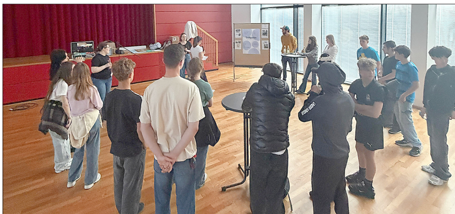
Die Ergebnisse der Umfrage wurden präsentiert und diskutiert.

Im Rahmen der Veranstaltung „Jugend spricht“ in der Stadthalle Kandel trafen sich kürzlich rund 35 Jugendliche, um über die Ergebnisse der Online-Befragung unter Jugendlichen aus der Verbandsgemeinde Kandel zu diskutieren und darüber zu entscheiden, welche Projekte mit den dafür bereitgestellten 5.000 Euro zunächst umgesetzt werden sollen. Die Wahl fiel am Ende auf den Bau neuer, wettergeschützter Treffpunkte, wie beispielsweise einem Unterstand.