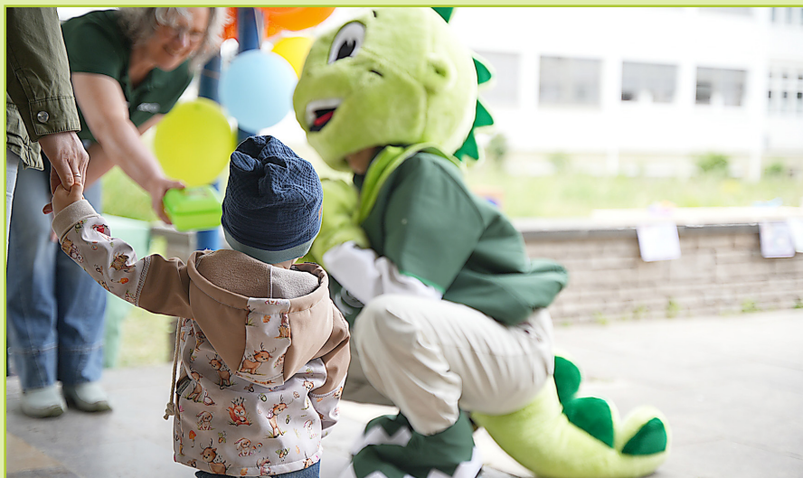
Gesunde Ernährung kindgerecht schmackhaft machen.

Das Programm ist vielfältig und bietet eine bunte Mischung aus Mitmachaktionen zum Entdecken und Ausprobieren. So können Kinder beispielsweise den Baby-Bewegungsanhänger des Netzwerks Frühe Hilfen erkunden und sich spielerisch ausprobieren. Dabei werden Koordination, Gleichgewicht und Selbstsicherheit gestärkt – und die Kinder erleben Bewegung als Freude; eine wertvolle Grundlage für ihre gesunde Entwicklung. Ergänzt wird das Angebot durch Mitmachtablets des Kita-Teams des Kreisjugendamtes, an denen die Kleinen spielerisch Elemente zuordnen oder Neues ausprobieren können. Auch die Sinne kommen