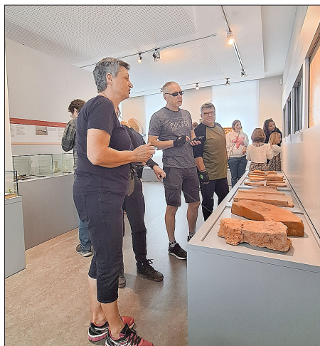
Terra-Sigillata-Museum Rheinzabern: außen Museumsfest, innen Ausstellung.