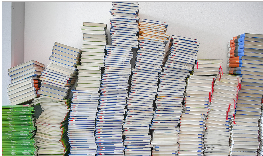
Viele Bücher für die Schülerinnen und Schüler.

In dem Portal hinterlegen die Eltern ihre Adresse und ihre aktuellen Kontodaten. Vom hinterlegten Bankkonto wird dann die Leihgebühr am 01.11.2026 abgebucht.