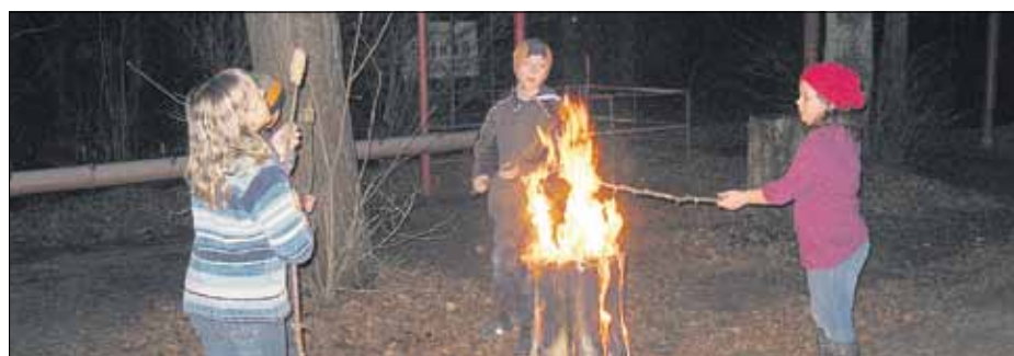
Am brennenden Holzstamm gebackenes Stockbrot schmeckte besonders lecker.

Die 3. Kandeler Brennholztage, veranstaltet vom Bündnis 90/Die Grünen in Kooperation mit der Stadt Kandel zeigten, dass Naturschutz und Naturnutzen-können durchaus zusammen passen. Beiträge des Naturschutzgroßprojektes Bienwald und der