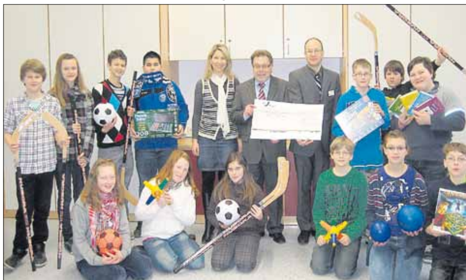
Bei der Spendenübergabe.