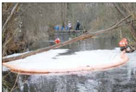
Vier Stunden benötigte die Feuerwehr zur Beseitigung der Ölverunreinigungen.

Die untere Wasserbehörde in der Kreisverwaltung Germersheim bittet die Bevölkerung ein besonderes Augenmerk auf die Gewässer im Kreis, vor allem auch im Bereich „Rauhweide“, zu richten. Bei wasserwirtschaftlich relevanten Gefahren ist die untere Wasserbehörde der Kreisverwaltung Germersheim Ansprechpartner. Sie kümmert sich um die oberirdischen Fließ- und Stillgewässer im Landkreis und das Grundwasser. Die Behörde ist erreichbar unter Tel. 07274/53-236 oder -308 bzw. u.berninger@kreis-germersheim.de oder g.berdel@kreis-germersheim.de.