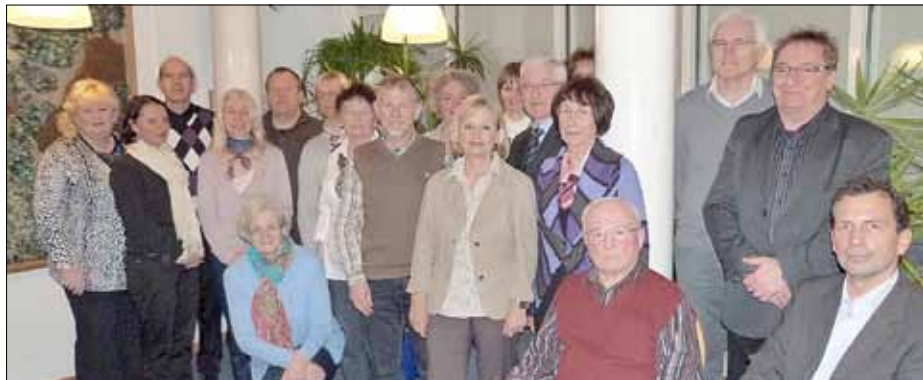
Die neuen ehrenamtlichen Betreuer gemeinsam mit Erstem Kreisbeigeordneten Benno Heiter und Norbert Pirron von der Betreuungsbehörde der Kreisverwaltung.

ungsbehörde, wieder einen Grundkurs für ehrenamtliche Betreuer durchgeführt. Die 20 Personen, die jetzt den Grundkurs besucht haben, übernehmen teilweise Betreuungen im familiären Umfeld oder wollen sich ehrenamtlich betätigen und sind bereit in Zukunft gesetzliche Betreuungen zu übernehmen. Nun wurden den Kursteilnehmern von Benno Heiter, 1. Kreisbeigeordneter, und Norbert Pirron von der Betreuungsbehörde der Kreisverwaltung Germersheim die Zertifikate übergeben. Gesetzliche Betreuung heißt eine Vielzahl von Dingen für einen kranken oder behinderten Menschen zu regeln. Der Grundkurs umfasste insgesamt sechs Abende. Angesprochen wurden Themen wie betreuungsrechtlich relevante Krankheitsbilder; das Verfahren der Betreuerbestellung, Aufgaben des Betreuers, die Rechtsstellung des Betreuten; der Aufgabenkreis der Personensorge, Gesundheitsfürsorge, Genehmigungspflichtige Heilbehandlungen, Unterbringungen; der Aufgabenkreis der Vermögenssorge, Geldanlage und Verwaltung, Sozialleistungen, Sozialhilfe, Wohnrecht;