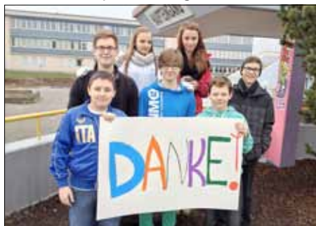
Den Umgang mit neuen Medien lernen die Schüler der IGS Rülzheim beim Webitur der VR Bank.