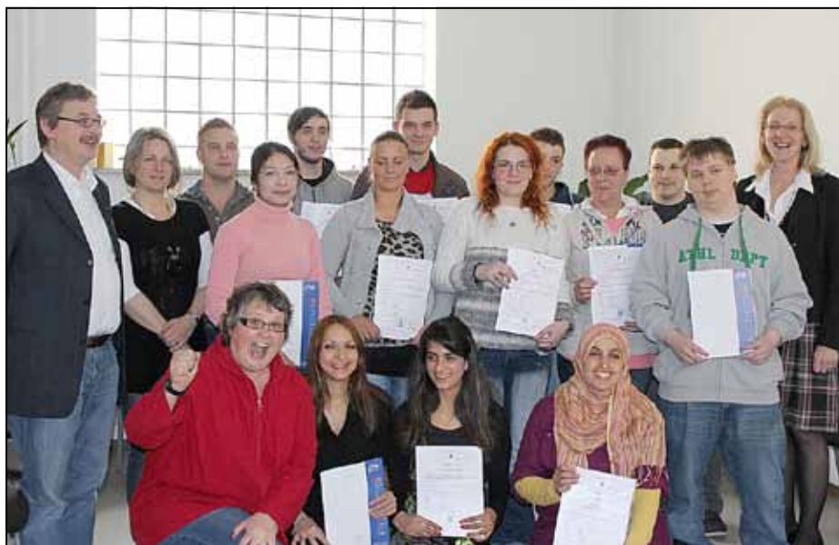
Strahlende Gesichter bei der Übergabe der Abschlusszeugnisse.

Fast ein Jahr lang haben die Teilnehmerinnen und Teilnehmer am Vorbereitungskurs für die „Prüfung für Nichtschüler zum Erwerb der Qualifikation der Berufsreife“ der Kreisvolkshochschule (KVHS) in Germersheim die Schulbank gedrückt. Seit Anfang April halten die erfolgreichen Schüler ihre Abschlusszeugnisse der Hauptschule in den Händen.