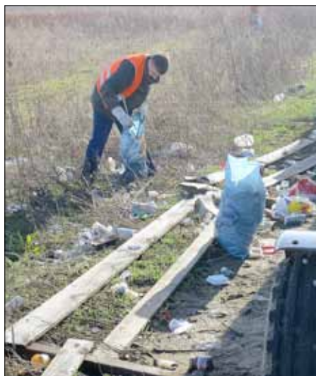
Am Wegrand findet sich allerhand Unrat.