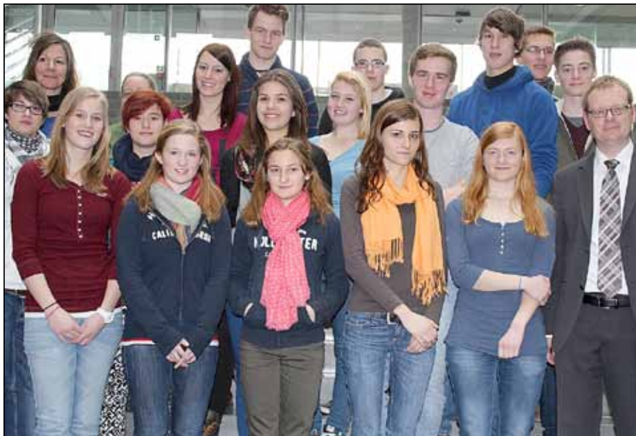
Die Teilnehmer der Reisegruppe in Berlin.